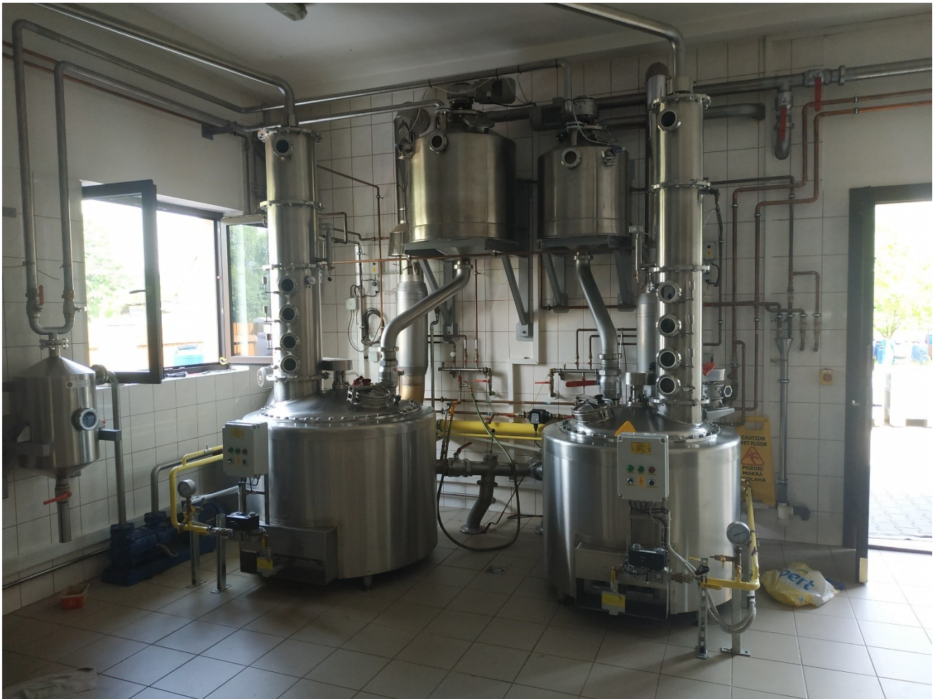
Obrázek č. 1: Foto kolon