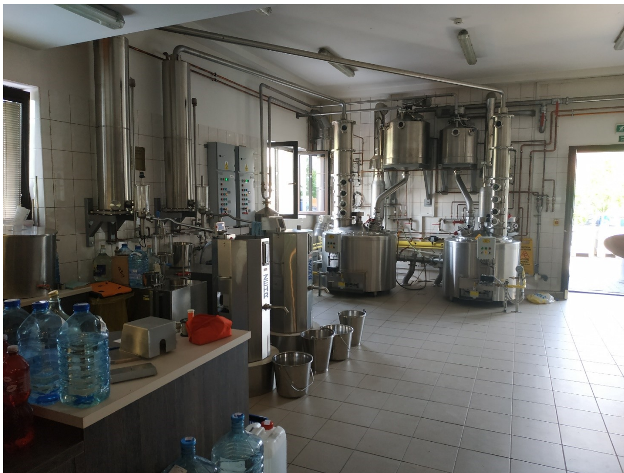
Obrázek č. 2: Foto kolon