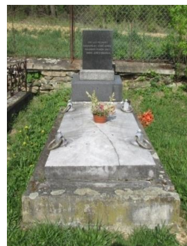
hrob neznámého sovětského vězně ubitého v Břevenci