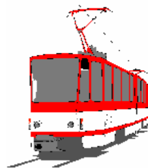
Vyprávění pana Janouška upravil František Bartoněk starší

restaurace. Teprve postupně jsem zjišťoval, že těch lákadel je víc, jedno z nich v minisukni dokonce přistoupilo blíž s prosbou o připálení cigarety. Nejsem žádný hrubián, ale nevyhověl jsem, otočil se a snad se i rozběhl po chodníku nazpět proti přijíždějící tramvaji. Jen na okamžik ve mne hrklo, zda neběžím špatným směrem. Zastavil jsem se a vtom uviděl v dálce proti mně přicházet dvě známé postavy. Nepamatuji se, že bych před tím ani potom s takovou radostí a úlevou uvítal manželku. Musím dodat, že následná exkurze Prahy již proběhla bez komplikací.