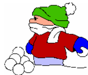
Rodiče dětí z MŠ Břevenec