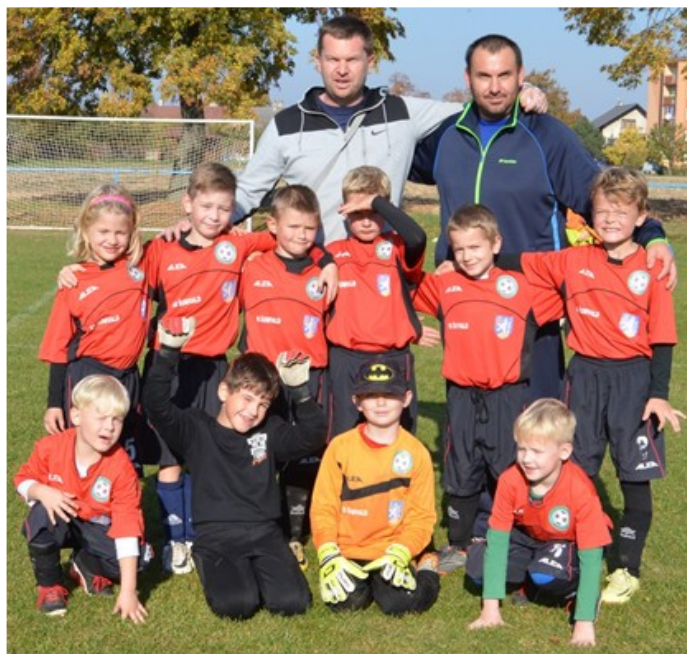
(zpracoval Mgr. Ladislav Vyhňálek)