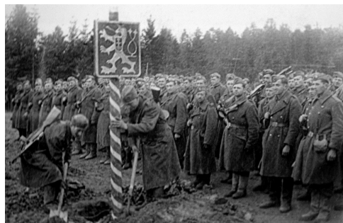
Čs. armádní sbor na hranicích Československa