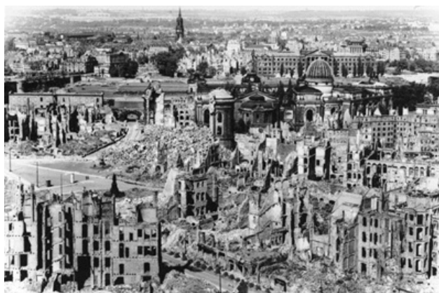
centrum Drážďan po bombardování