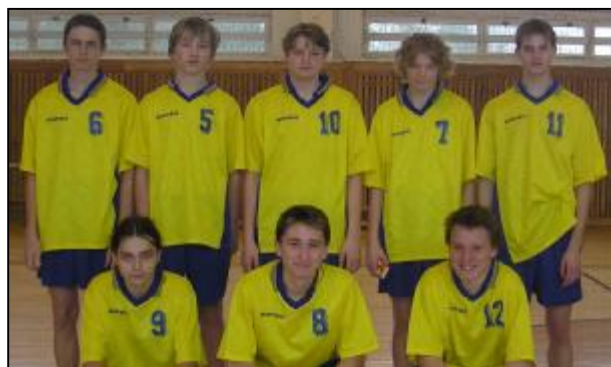
Vánoční turnaj v košíkové chlapců.