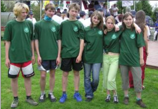
tělocvičny. Tam se nakonec šestičlenné týmy ze 13 škol