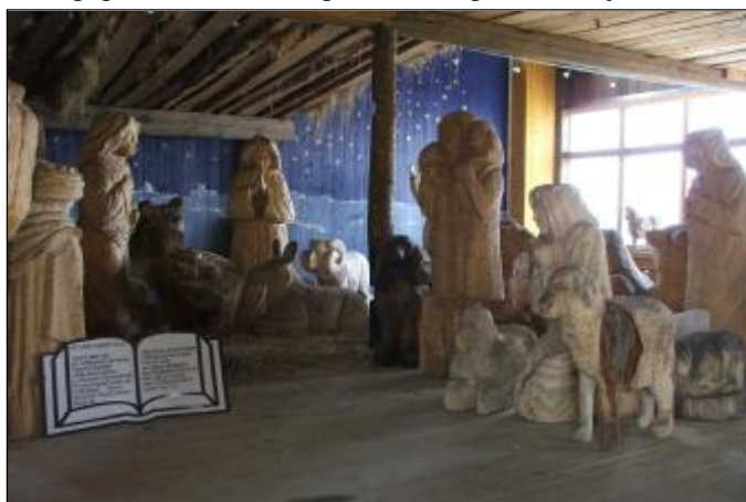
Největší betlém v Evropě

K vidění je i chovné stádo živých daňků v ohradě, shozy jsou pečlivě popsány a datovány. Na trase jsou vystaveny spolu s parohy srnčí a jelení zvěře.