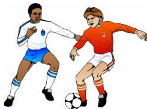
Zapsal Ladislav Vyhnálek

23. 9. v Šumvaldě: 4. místo, Šu - Paseka 1:11, Šu -Troubelice 2:4, Šu - Uničov 1:3 (Z. Bartoněk 2, M. Kolář 2)