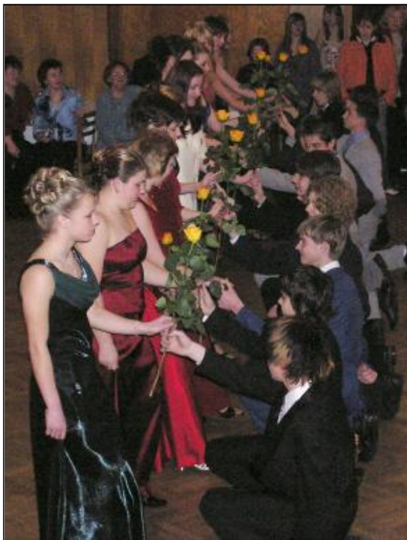
Fotografie z vystoupení žáků deváté třídy na plese SRPŠ konaném v sobotu 11. února v Blahákově hostinci.