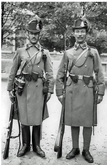
příslušníci královského četnictva